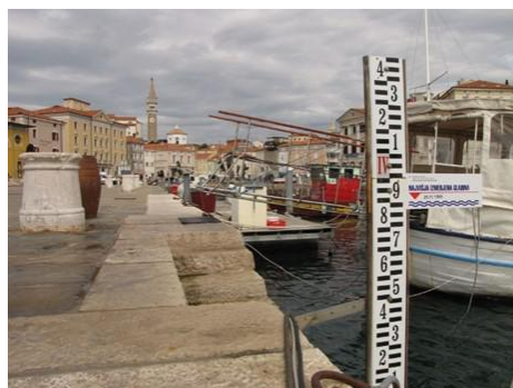
Morje začne poplavljeni najnižje dele obale, ko gladina doseže 300 cm na mareografski postaji v Kopru. 25. 11. 1969 je višina gladine morja v Piranu dosegla višino 394 cm.