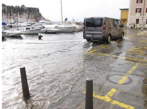
Poplavljen cesta ob piranskem mandraču, 17. 11. 2019. Zgoraj desno je vidna stavba akvarija, kjer je bila letos nameščena oznaka z najvišjo gladino morja 12. 11. 2019.

leriji Rex. Postavitve oznak visokih voda ozaveščajo in izobražujejo javnost o visokih vodah ter hkrati prikazujejo, kakšno moč in dinamiko imajo naše reke, jezera in morje. V akciji sodelujejo Agencija RS za okolje, Zveza geografov Slovenije, Ministrstvo za okolje in prostor, lokalne skupnosti, izobraževalne ustanove ter številni posamezniki.