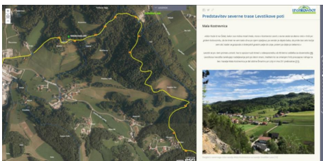
Primer predstavitev dela severne trase Levstikove poti s pomočjo zgodbe z zemljevidi (story maps).

Povezave do aplikacij in vprašalnikov so dostopne na spletni strani Levstikove poti: če še niste šli na popotovanje od Litije do Čateža, se tega lahko zdaj lotite najprej navidežno, s pomočjo spletnih aplikacij, nato pa še geoinformacijsko podprto na terenu.