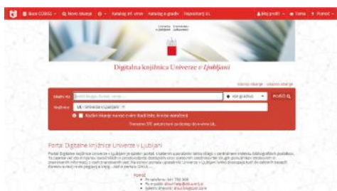
Začetni zaslon novega DiKUL-a.

Novi DiKUL se sedaj nahaja na splet- ni strani Cobiss+, kjer v levem kotu zgoraj izberete "Baza podatkov" in med njimi DiKUL. Neposredna pove- zava pa je https://plus- ul.si/cobiss.net/opac7/bib/search? db=ul&ds=true . Prednost novega portala je, da na enem mestu omogo- ča hkrati dostop do elektronskih vi- rov in dostop do knjižničnega katalo-