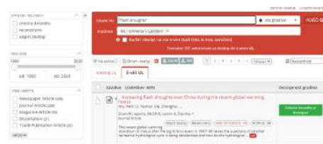
Seznam zadetkov (vir: DiKUL).

gu (privzeta nastavitve je iskanje po vseh katalogih knjižnic UL). V de- snem zavihku (E-viri UL) so rezultati iskanja po elektronskih virih. Ob strani so nanizani različni filtri, s ka- terimi lahko seznam rezultatov še izboljšate (leto izida, tip gradiva, publikacija, področje ipd.). Ali je gra- divo dostopno, pove zelen gumb, s klikom nanj pridete do gradiva. Če celotno besedilo gradiva ni dostopno, je ta gumb siv. Klik na gumb vas pri- pelje do dodatnih možnosti za pridobitev tega gradiva.