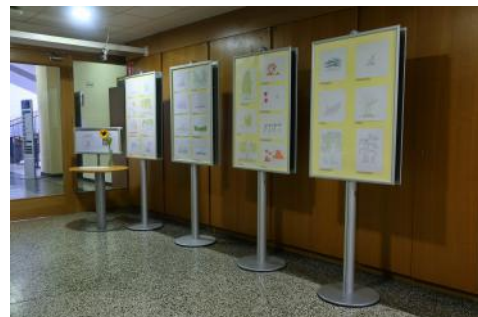
Razstavo si je mogoče ogledati na hodniku Oddelka za geografijo vse do 12. 10. 2020.

skupaj bomo našli primeren način, da se bo pogosteje slišalo o vaših interesih in dosežkih. Korajža velja!