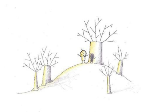
Razstavi je naslov »Hvalnice« in je nastala spontano, kmalu po rojstvu knjige malih ilustracij, ki ima enak naslov.