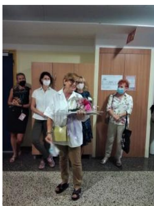
Zorka je iz rok predstojnice Oddelka za geografijo FF UL prejela zahvalo za nje- no večletno delovanje na našem Oddelku (foto: L. Rebernik).

Mihevc. 20 generacij naših študentov je tako v letnem semestru spoznava- lo geografijo krasa – v anketah, ki jih izvajamo ob koncu leta, so študentje vedno zapisali, da so »...terenske vaje s krasom na Balkan dogodek leta«. Kolegu Andreju se iskreno zahvalju- jemo za predano pedagoško delo, za dolgoletno razvijanje povezav med Inštitutom za raziskovanje krasa ZRC SAZU in našim oddelkom, za zvrhane koše domislic in anekdot, kar je v številna geografska srca in razum vsejalo seme krasa.