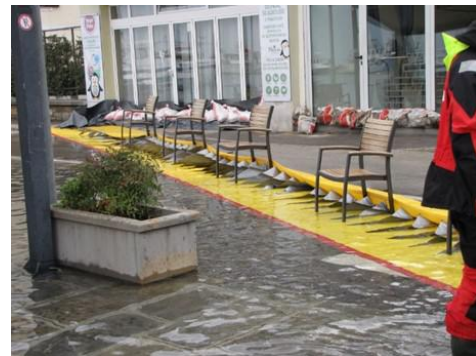
Protipoplavna pregrada za zaščito gostinskih lokalov na Sončnem nabrežju v Izoli ob visoki vodi 13. 11. 2019.