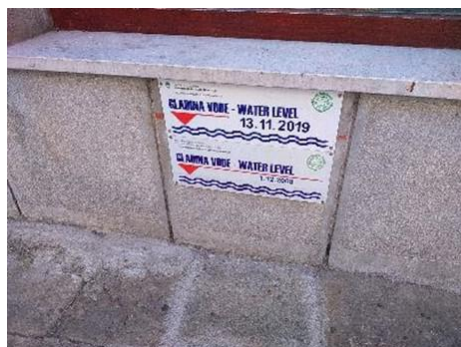
Dve oznaki visoke vode v Izoli: spodnja označuje gladino iz leta 2008 na višini 30 cm od tal, zgornja pa gladino iz leta 2019 na višini 44 cm od tal.