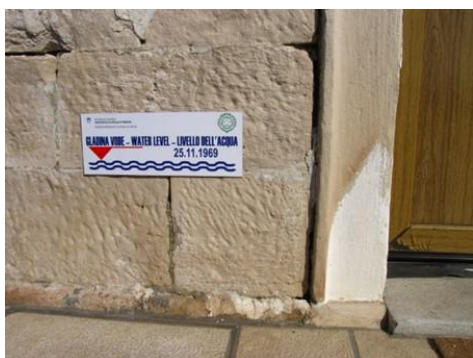
Tablica na pročelju stavbe Uprave za pomorstvo v Kopru označuje najvišjo izmerjeno gladino morja 25. 11. 1969, ko je gladina morja segala do višine 394 cm. Morje začne poplavljeni najnižje dele obale, ko gladina doseže 300 cm na mareografski postaji, ki je nekaj metrov stran.

Septembra 2020 sta bili v Kopru in Piranu postavljeni dve novi oznaki visokih voda. Označujeta najvišjo zabeleženo gladino morja 12. novembra 2019 v Piranu ter 25. novembra 1965 v Kopru. V Piranu je oznaka nameščena na stavbi Akvarija Piran, v Kopru pa na stavbi Uprave za pomorstvo.